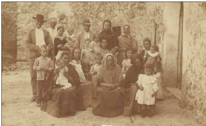
10. Família de Can Comte. Principis del segle xx.