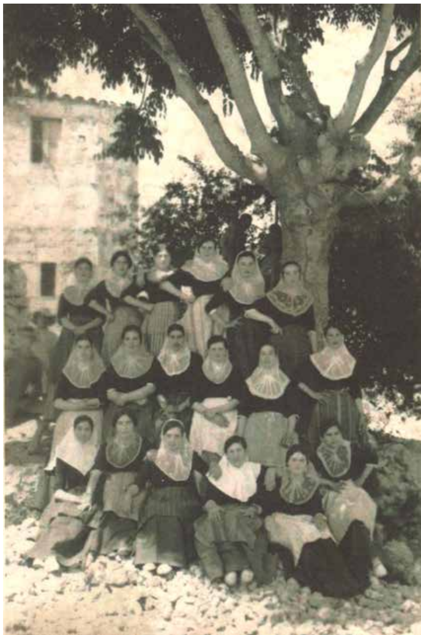
11. Grup de pageses baix el lledoner de la Font de Pina.