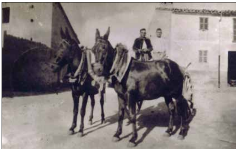
3. Parellers de Son Ribes.