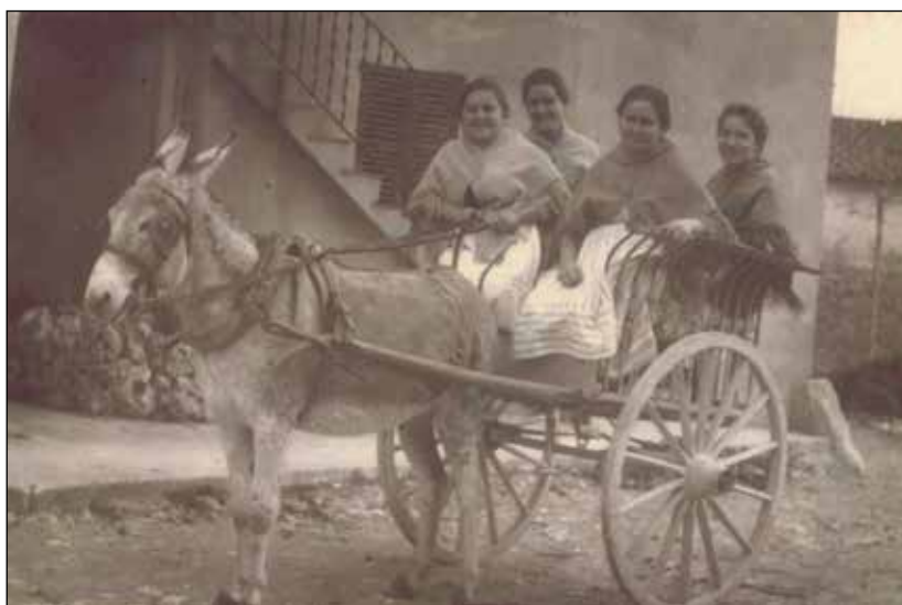
6. Passejant en carretó per la clastra de Son Ribes.