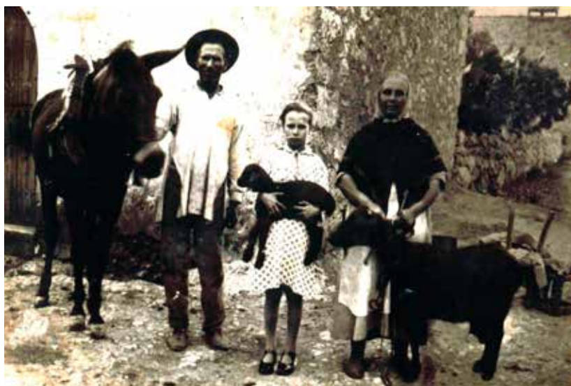
9. Família de Can Foc.