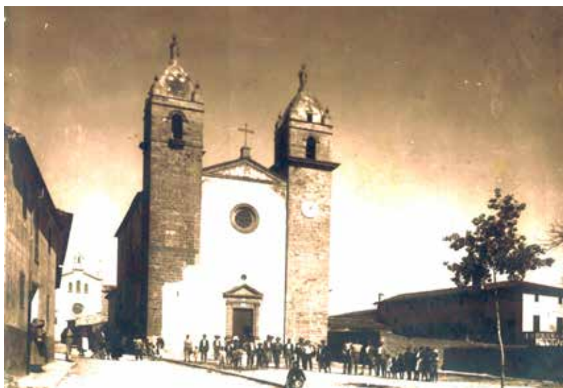
4. Plaça de Pina. Anys 1920-1930.