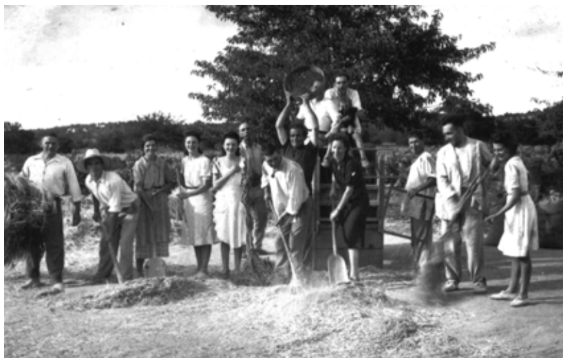
7. Damunt s'era des Molí.