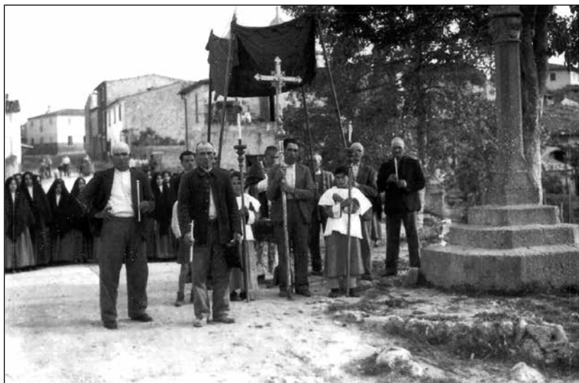
1. Benedicció dels fruits a la creu de l'entrada de Pina. Devers 1930.