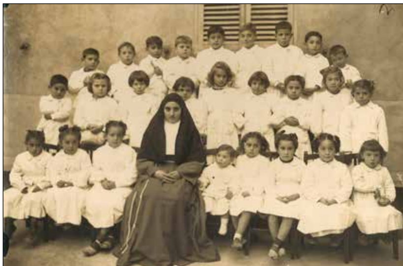
5. Infants a l'escola de Ca ses Monges. Any 1949.