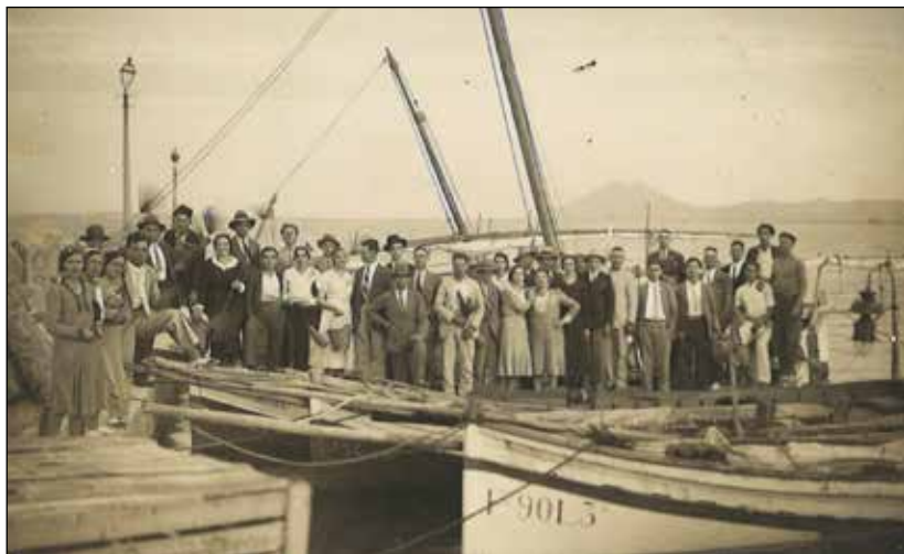
14. Excursió al Port de Pollença. Devers 1930.

San Antoni va partir cap an el desert a peu a dins un temps molt cruel de calor, de fred i gel dins el desert va patir però per lo que sofrí va arribaran el bon fi que Jesucrist li obrí totes ses portes del cel. [SC]